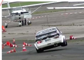
genehmigt durch den DMSB unter 17/2015