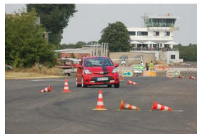
genehmigt durch den DMSB unter 16/2015